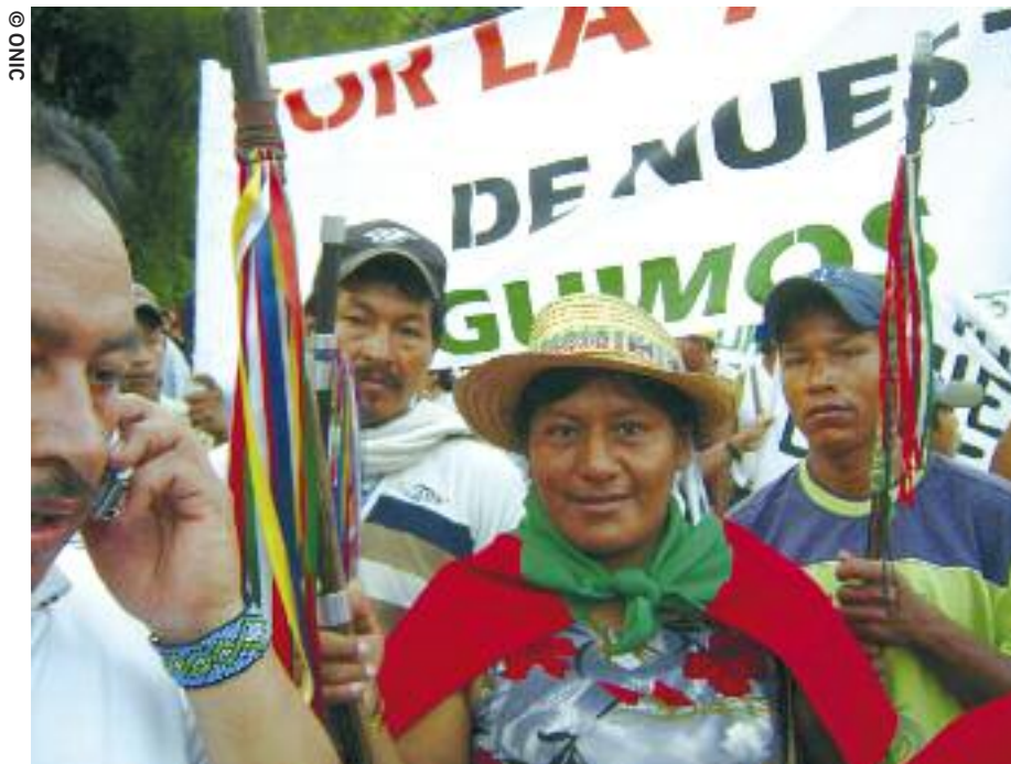
Aída Quilcué (au centre) pendant la Minga à Santander de Quilichao, dans le département du Cauca, 24 octobre 2008.

les dirigeants indigènes qui défendent les droits de leurs communautés.